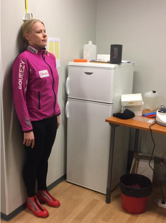
Kuva 1. Urheilijan mittaus: Hiihtokengät jalassa, ilman päähinettä