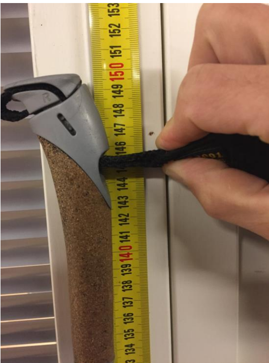
Kuva 3. Hiihtosauvan mittaus: Sauvan piikin kärjestä hihnan kiinnittymiskohtaan