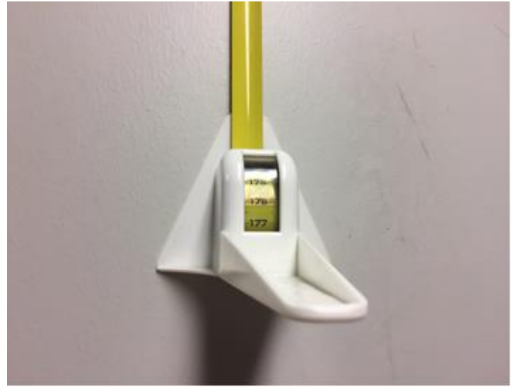
Kuva 2. Pituus ylös